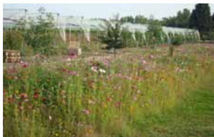
Châtaigniers et noyers en bordure de parcelle