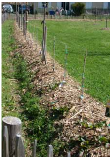
Haie sur butte couverte de BRF