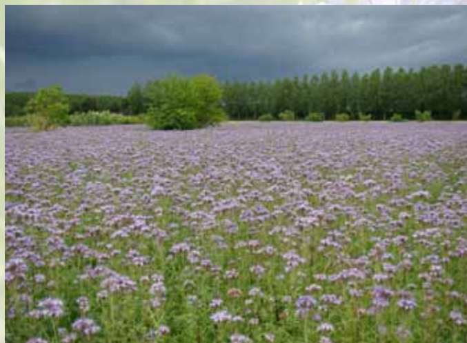
Préparation du sol en 2010 puis semis de Phacélie (photo 4 juin 2010).

La croissance des arbres est rapide, ce qui permet une mise à fruit précoce et abondante.