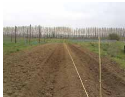
Sol émiétté et butté

Pour le moment en verger, afin de créer ces vides rapidement, nous continuons à préparer mécaniquement les sols, en nous aidant d'un apport massif de matières organiques. C'est ce que l'on a présenté dans le numéro 42 de notre revue, en relatant avec photos à l'appui, la première année de croissance des pêchers de la parcelle de collection de Montesquieu.