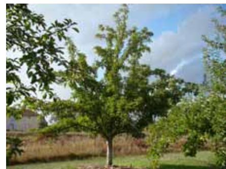
L'effet du brottrunk : un feuillage très vert tout au long de l'année. Photo 12 octobre 2012.

ons testé les purins de prêle, ortie et fougère fabriqués par J.C.I. Chevillard à Angers ( www.j3c-agri.com ). La biodiversité microbiologique est aussi proposée par une autre société la SOBAC avec un amendement le bactériol pour les sols et le bactériolite pour les litières animales. Composés de matières d'origine végétale et minérales compostées, ces amendements organiques et produits litières, renferment un noyau de micro-organismes prélevés sur différents sols Aveyronnais. Ils agissent en améliorant la structure et la fertilité des sols. Nous n'avons pas encore utilisé cet amendement dont l'action semble se rapprocher de celle du BRF en accéléré ( www.bacteriosol-sobac.com ). Existe en jardinerie sous le nom de bacteriosol jardin (50 à 100 g/pieds).