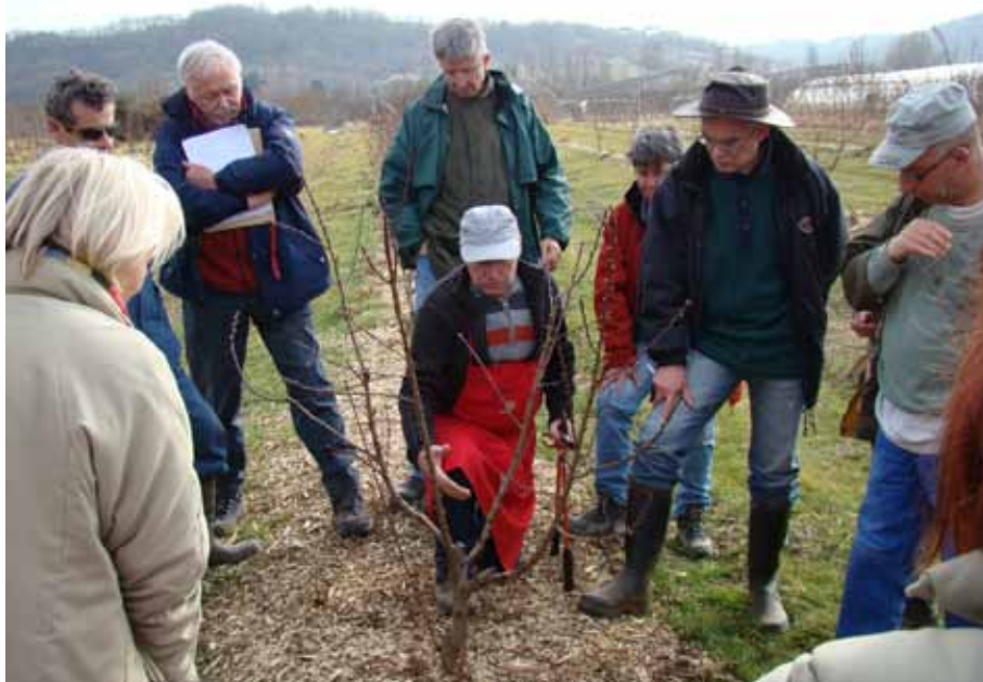
Poursuite de la formation des pêchers, 3 mars 2012

cocement. Les récoltes les plus abondantes ont été repérées, entre autres, chez les variétés de pêches Roussane de juillet, Canari, Muscade... chez la Pavie Porcelaine téton et la pavie des vignes jaune citron (non au catalogue), chez plusieurs pêches et persègues de type sanguine (dont la Sanguine tardive), ... chez les différents brugnons blancs, le Rosé de septembre, le brugnon à chair jaune de mi-août (le plus fertile d'entre tous, non au catalogue) et la nectarine alberge (qui figurera au catalogue de la pépinière à partir de l'hiver 2013-2014). Ces premières observations nous ont aussi permis de détecter parmi les fruits à chair rouge de nos collections, une variété de pavie sanguine (dénommée Crotte de bique) génétiquement à feuillage et chair jaunes (contrairement au caractère général où les vineuses ou sanguines sont génétiquement issues des pêches à chair blanche).