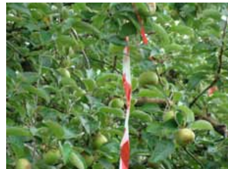
Branches repérées pour notations de croissance

Que cherchons-nous ? un modèle de verger « durable » où un ensemble de facteurs vont agir en lien les uns avec les autres pour offrir une protection aux plantes, qui seraient moins sujettes aux attaques parasitaires si aliénantes en verger à l'heure actuelle.