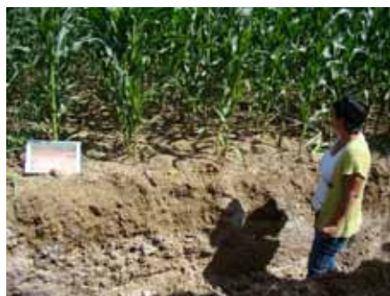
Enracinement du maïs dans le sol travaillé sous retournement

Journée consacrée aux nouvelles techniques agricoles durables et agriculture de conservation.