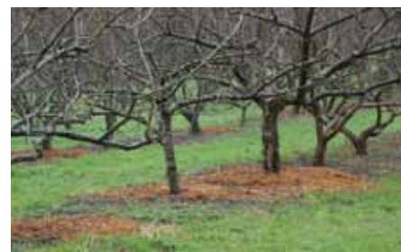
Pommiers paillés au BRF de pommier (très orangé)

Le verger qui a peu poussé en 2011, n'a pas nécessité une taille importante. L'effet du foehn entraîne une réduction de croissance des arbres dans la partie haute du verger et des dessèchements en partie basse. Les arbres morts seront replantés en avril avec les invendus de la pépinière du Conservatoire soit 114 arbres et 36 porte-greffe à greffer en place en mars 2013.