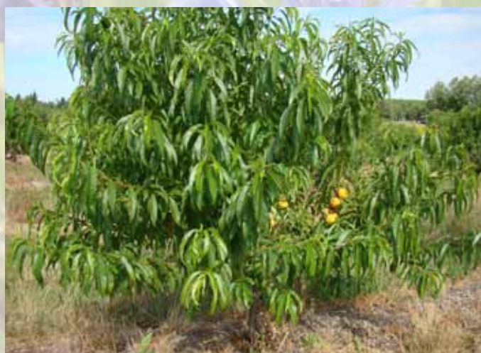
Fructification de la pêche CANARI, le 3 août 2012 avant récolte.