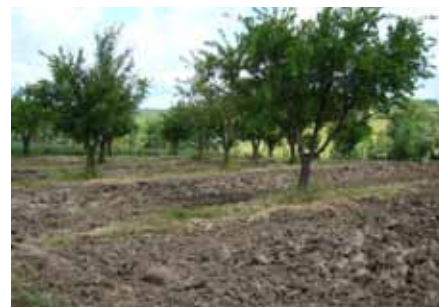
Préparation du sol pour protéger les bulbes de tulipes, 4 juin 2012

Pour assurer la protection de la tulipe d'Agen le CEN Aquitaine a acquis ce verger et tente de le réhabiliter, les pruniers très âgés ayant besoin d'être renouvelés. Le CEN ayant souhaité participer d'un même coup à la conservation d'un patrimoine régional lié au prunier, le Conservatoire a organisé le greffage des clones de prunes d'Agen prospectés par M. René BERNARD à l'INRA de Bordeaux dans les années quarante ainsi que des clones que le Conservatoire a prospecté au début des années quatre-vingt ainsi que des arbres d'autres espèces locales. http://www.cren-aquitaine.fr/patrimoine/fiches/VILLEBRAMAR.pdf .