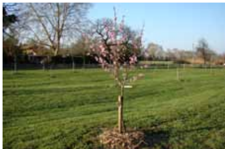
Verger en fleur

La croissance des arbres est excellente sauf les vignes un peu faibles. L'état sanitaire est très satisfaisant.