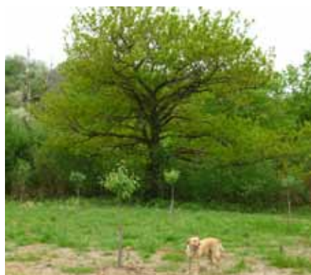
Jeune verger dans la forêt de chênes