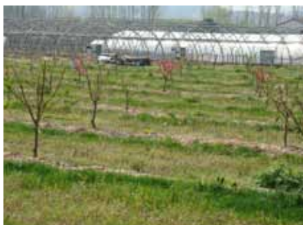
Floraison des pêchers, 2 avril 2012

A près une préparation du sol en avril 2010 par le travail mécanique successif de trois outils et un gros apport de matière organique, nous avons semencé avec un couvert végétal (la phacélie*) qui a donné une belle parcelle fleurie violette. Nous lui avons laissé faire son cycle complet jusqu'à ce que la plante sèche sur place. A l'automne, le sol a été repris mécaniquement, amendé de nouveau avant le buttage des lignes. Les arbres furent rabattus à la plantation à 40cm au-dessus du point de greffe en janvier 2011.