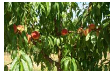
Première production de « Charles Roux », photo 3 août 2012

Nous allons nous donner les moyens en 2013 de décrire toutes les variétés de pêches de cette collection qui ne l'ont pas encore été et, pourquoi pas, rêver d'une étude génétique par analyse moléculaire, mais ceci est lié à une aide financière conséquente.