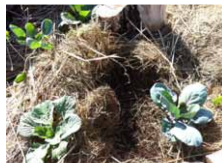
Plantation des choux fin août