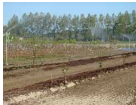
Paillage au BRF (verger de pêchers - Mars 2011)