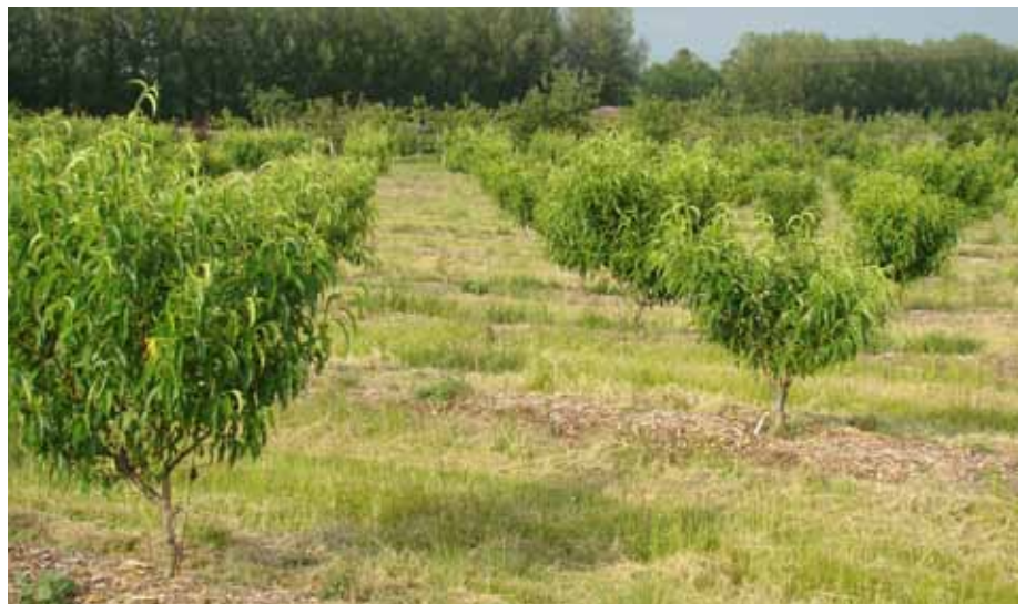
Verger paillé et arrosé, photo 2 juin 2012

Le bienfait de ces buttes amène tous les arboriculteurs des vallées et des sols un peu difficiles à les mettre en place depuis 50 ans. L'aération considérable du sol où sont concentrées les matières organiques a permis d'obtenir une reprise à 100% et une croissance extraordinaire de nos pêchers. L'année même de la reprise, Bertrand a pu former les structures de l'arbre par une intervention de taille le 16 juin. L'arrosage en cette année 2011