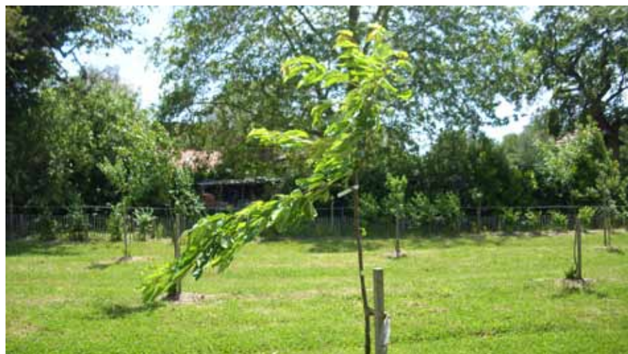
Arbre en situation venteuse, bien maintenu par un piquet arrimé sous le départ de la couronne.

Retenons que pour l'implantation d'un verger, les conditions de sol doivent être aussi bonnes que celles d'un jardin ou d'une grande culture car, en plus, les racines devront progresser dans ce même sol durant plusieurs dizaines d'années contrairement aux légumes ou aux céréales dont on reprepare le terrain chaque année. Comme une terre de jardin finit toujours par s'ameublir, (sauf si le jardinier travaille mal et appauvrit la matière organique de son sol), on en déduit qu'il vaudrait mieux travailler son terrain plusieurs saisons avant la plantation. Sinon, il faudra accepter d'intervenir sur les couronnes pour les rééquilibrer par rapport au système racinaire sous développé et retarder la première mise à fruits de plusieurs années.