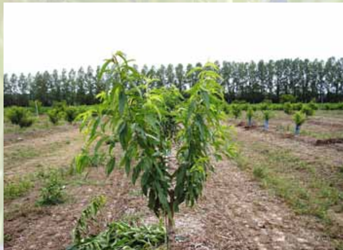
Taille en vert des pêchers, le 16 juin.