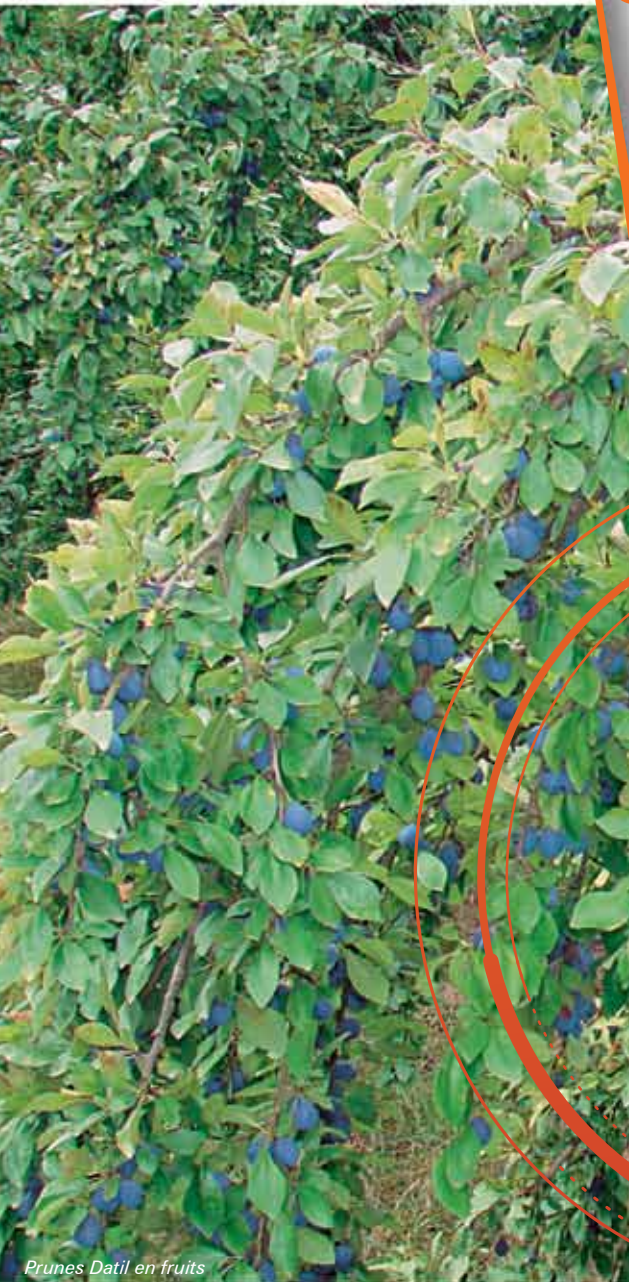
Prunes Datil en fruits