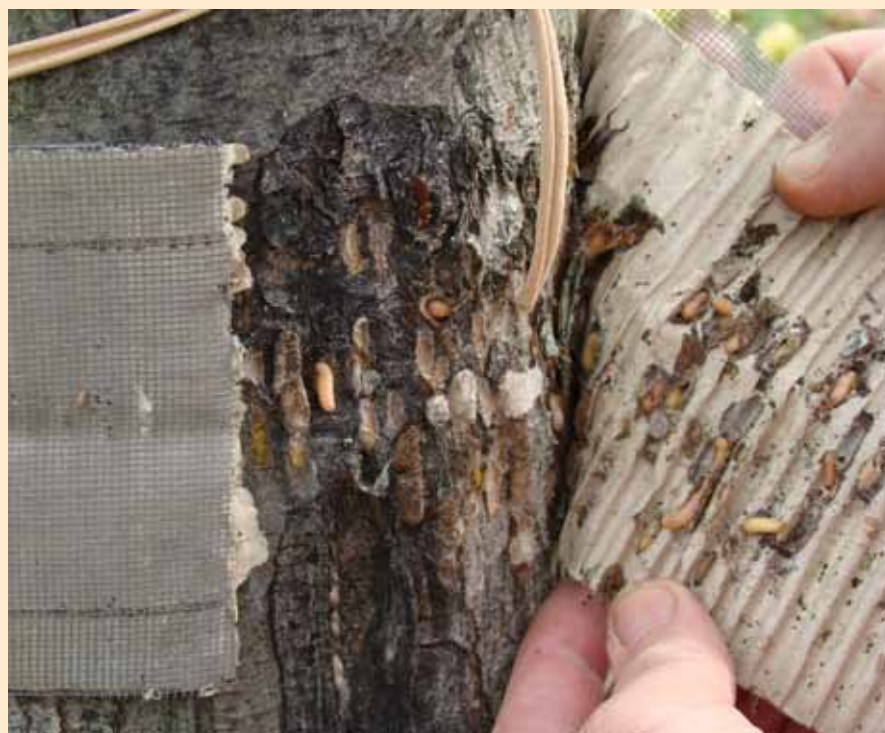
Bande piège en carton ondulé autour d'un tronc de pommier, verger musée Montesquieu, 12 octobre 2012

Ainsi après quelques années de piégeage on constate une nette diminution des vers dans les fruits. On peut aussi associer des poules au verger qui pourront détruire une partie des pommes véreuses tombées au sol.