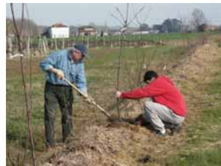
Plantation sur butte paillée

qui nous a fourni à titre gracieux de quoi protéger une parcelle d'un hectare et demi pendant une année. Le Brottrunk est issu de la fermentation longue de pain et céréales à PH très acide et riche en micro-organismes ( www.kanne-brottrunk.fr ). Quant à la société Frayssinet, elle propose différents amendements de grande qualité le végéhumus et l'orga3 que nous épandons de longue date au verger de Montesquieu et sur nos sites d'accueil, ainsi que différents produits de la gamme Anthys en pulvérisation foliaire et l'Osiryl stimulateur de croissance racinaire ( www.groupe-frayssinet.fr ).