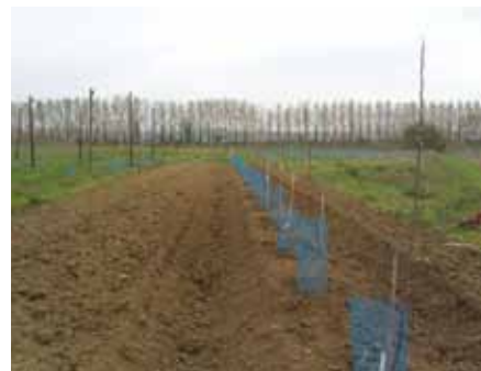
Plantation dans la butte