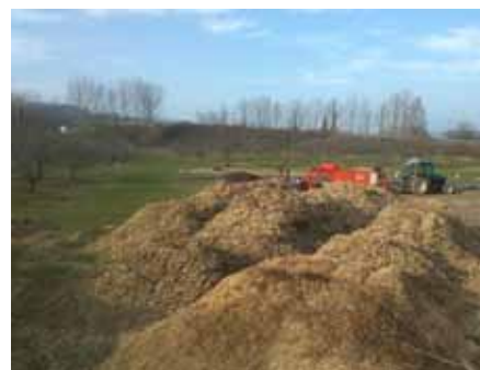
Livraison de BRF de noisetier