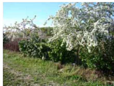
La haie du Conservatoire