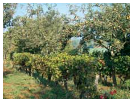
Jouales du Lot-et-Garonne en 2012

L'association la plus organisée a été la jouale ou canse où 3 cultures ont été établies sur les mêmes parcelles. On retrouve ces systèmes complexes dans tous les pays du monde, et tout particulièrement dans les zones fortement ensoleillées.