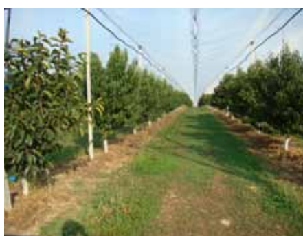
Pêchers et plaqueminières