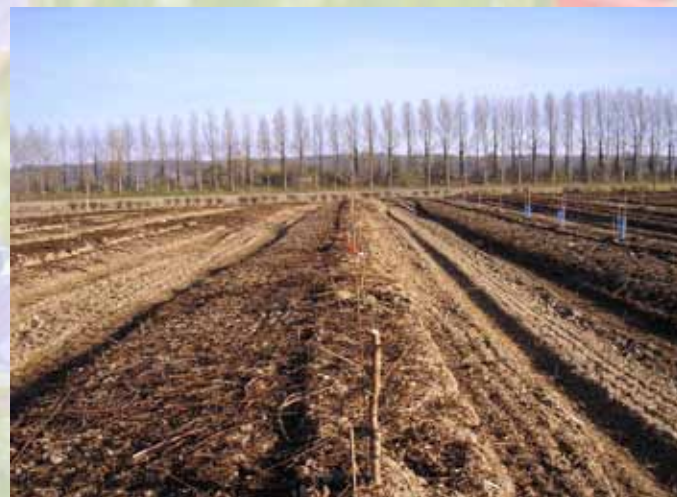
Plantation du verger sur butte le 30 janvier 2011, couverte de BRF le 13 mars.