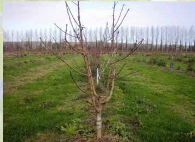
Après une année de croissance, le 4 janvier 2012.